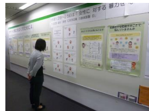
▲パネル展示の様子