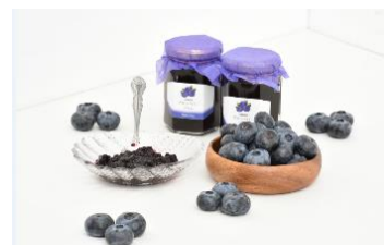
▲練馬産ブルーベリーやブルーベリーを使った加工品

今年度、ブルーベリーに特化したマルシェ「ねりまブルーベリーマーケット」を区役所1階アトリウムにて初開催します。練馬産ブルーベリーやブルーベリーを使った加工品、お酒などブルーベリーを存分に味わえる商品を取り揃えています。練馬の夏のお楽しみ、ブルーベリーをぜひご賞味ください。