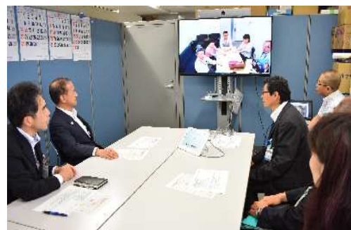
▲テレビ会議（デモ）の様子

今後は、個別ケースの支援検討会議の開催や児童相談センターの専門職からの助言・指導等を受けるなどして、テレビ会議を活用した新たな児童相談体制に向けた連携の強化を図っていく。