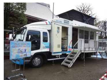
▲降雨体験車による豪雨体験