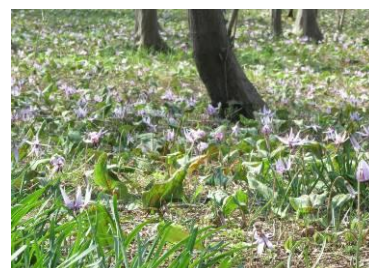
▲カタクリが群生して咲く様子(過去の様子)

カタクリは、種子から花が咲くまでに7～8年かかり、草丈は10cmほど。2枚葉を出し、2枚の葉から出る茎の先に花をつける。花は通常薄紫色で下を向き、6枚の花びらを外に反り返らせて咲くのが特徴。一株の開花期間は一週間程度で、例年3月下旬から4月上旬にかけて次々に咲き始める。