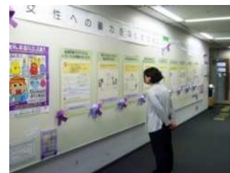
昨年のパネル展の様子