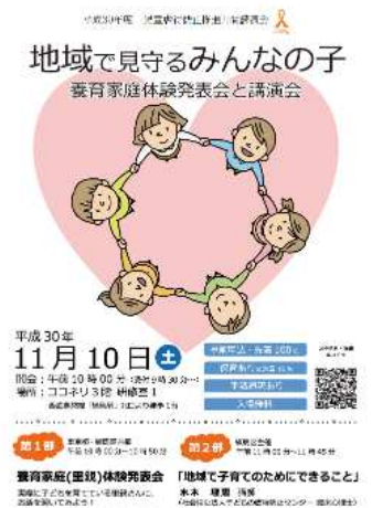
▲講演会周知ポスター