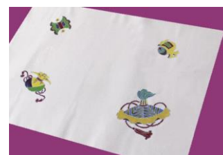
▲作品イメージ 東京手描友禅