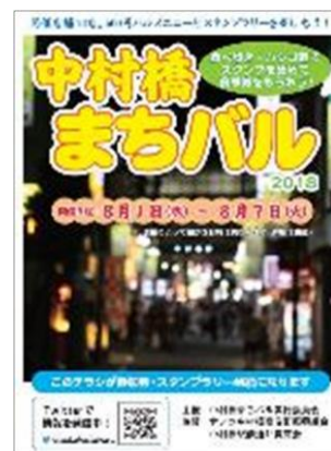
▲中村橋まちバル ちらし