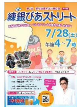
▲練銀びあストリート ちらし