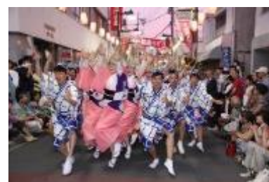
▲きたまち阿波踊りの様子