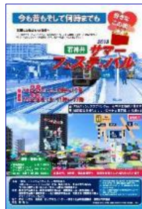
▲石神井サマーフェスティバル2018 ちらし