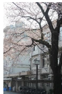
▲現校舎と桜の様子