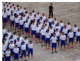
▲運動会で校歌を歌う様子

撮影した写真は、9月以降から使用する仮設校舎で展示し、卒業生や地域の方に披露する。