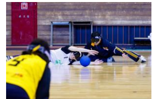
▲ゴールボール体験のイメージ

パラリンピック正式競技「車いすバスケットボール」について、未経験の方でも体験しやすいように、ゴールを人が担い、コート内は競技用車いすを使用する「車いすポートボール」の形式で行います。