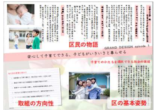
暮らしのグランドデザイン（ページ例）