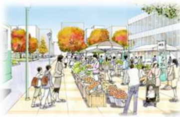
地場農産物のマルシェ