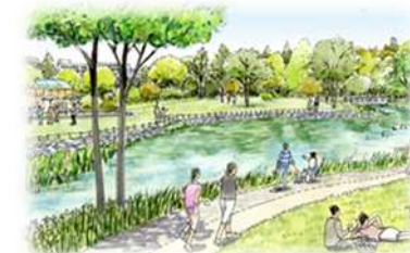
楽しみと安全をもたらす大規模公園