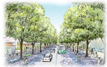
みどり豊かな幹線道路