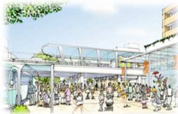
多くの人でにぎわう駅前空間