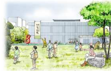
文化芸術の香り高いまち