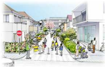
安全性を高めた生活道路