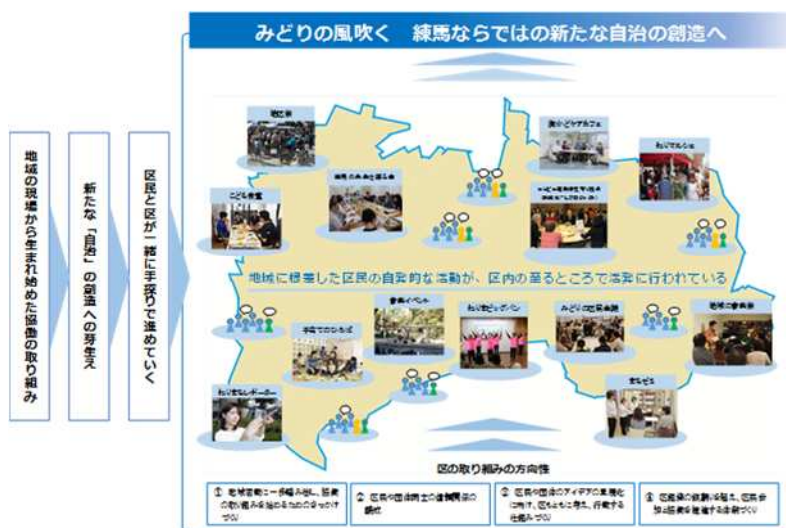
区民参加と協働のグランドデザイン（ページ例）

区ホームページ http://www.city.nerima.tokyo.jp/kusei/jorei/grand_design/grand-design-release.html