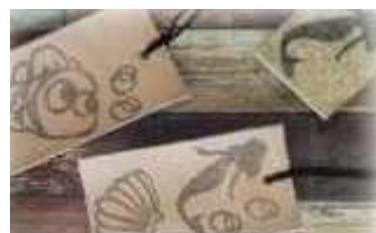
おもしろ・かんたん工作作品例