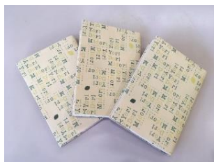
▲オリジナルグッズ例(ブックカバー・エコバッグ)

稲荷山図書館では、英字新聞で手作りしたエコバッグをプレゼント。光が丘図書館の大人向け福袋(文庫本のみ)では、練馬区の広報キャンペーン「よりどりみどり練馬」のロゴが入ったブックカバーなど、オリジナルグッズ入り限定福袋を用意します。