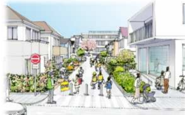
安全性を高めた生活道路