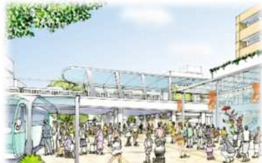
多くの人々にぎわう駅前空間