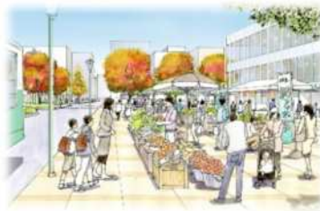
地場農産物のマルシェ