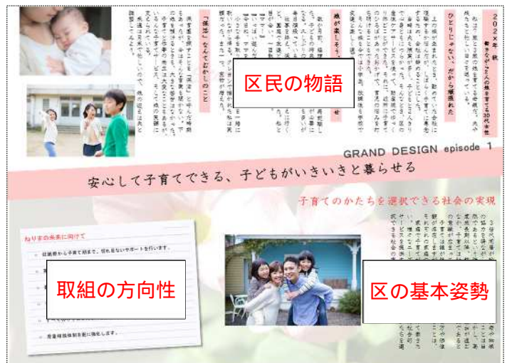
暮らしのグランドデザインページ例