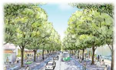
みどり豊かな幹線道路