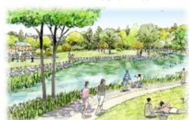
楽しみと安全をもたらす大規模公園