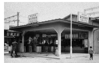
▲昭和40年頃の富士見台駅