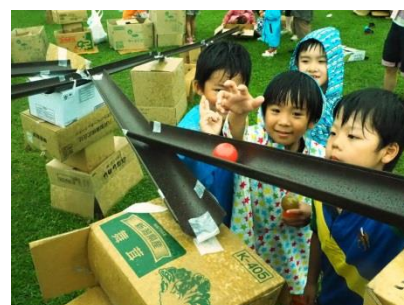
▲巨大ピタゴラ装置

雨どい、ダンボール箱、廃材などを利用し、巨大なピタゴラ装置を作成後、木の実やカラーボールなどを転がし、ゴールまでたどり着けるかチャレンジするイベント。参加した子ども達は、真剣な表情で試行錯誤しながら、ピタゴラ装置を作成。カラーボールがゴールまでたどり着くと、満面の笑みを浮かべていた。