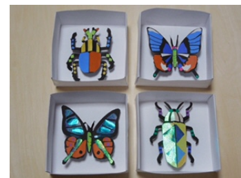
▲ワークショップの 作品一例

【問い合わせ先】 練馬区 文化・生涯学習課 文化振興係 ☎03-5984-1284