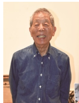
▲ 野見山 暁治さん