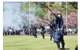
▲鉄砲隊演武の様子

照姫まつりは、室町時代中期に石神井城を本拠地とした豊島泰経の娘として語り継がれている照姫にちなんだまつりで、毎年、春に開催されている。照姫は、石神井城が太田道灌(おた どうかん)により落城した際、泰経の後を追って自らも三宝寺池に身を投げ、命を絶ったと言われている。