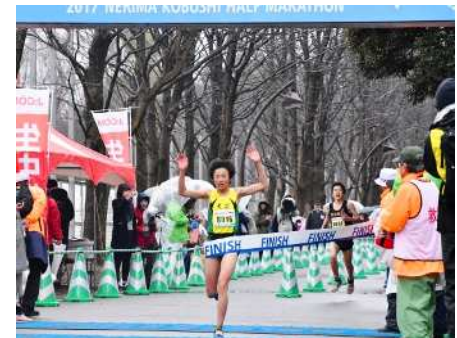
中学生も全力疾走!(マイルラン)

会場に設けられたイベントブース「よりどりみどり練馬ストリート」には、40近くの団体が出展。大勢の来場者が、大型ビジョンでマラソン中継を観戦したり、ゲストランナーのほか、オリンピック金メダリスト荻原健司さんや金藤理絵選手、練馬区在住で車椅子バスケット日本代表の石川丈則選手によるスペシャルトークショーや飲食エリアなどを楽しんだ。また、レース終了後、練馬産大根を使用したずしる汁が振る舞われ、ランナーたちはレースで疲れた体を癒していた。