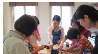
▲マフィン作りをする受講者(前回の様子)