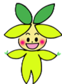
「練馬みどりの葉っぱい基金」のキャラクター「びいちゃん」

役割：練馬のみどりの育成・管理や区民協働のあり方について検討し、区緑化委員会へ報告