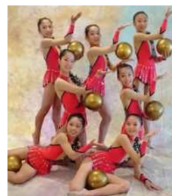
練馬区新体操連盟