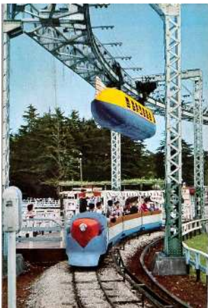
豊島園「空飛電車」 昭和30年代頃