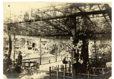
兎月園昭和初期