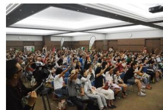
完成披露試写会の様子