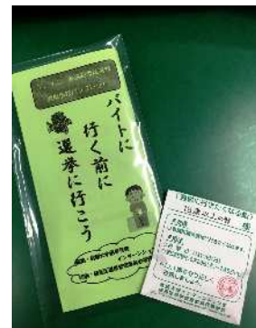
選挙に行きたくなる飴が入った袋(右)と啓発パンフレット(左)

インターン生の女子学生は、「なぜ自分たちの世代が投票に行かないかを考えた結果、選挙のイメージが堅くて難しいからという意見があった。若い世代に、選挙に少しでも興味をもってもらえるように、今回のグッズを作成した」と話している。