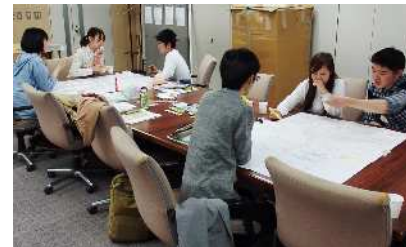
インターン生のミーティングの様子

今月30日(木)に、西武池袋線江古田駅周辺で、学生が多いお昼前後に狙いを定めて、これらのグッズを配布する街頭啓発活動を行う予定だ。