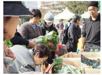
▲即売会の様子 (イメージ)

販売予定の農産物：キャベツ、大根、ブロッコリー、トマト、キュウリ、ジャガイモ、カブ、小松菜、人参、ナス、タマネギなど ※農産物の種類は変更になる場合があります。