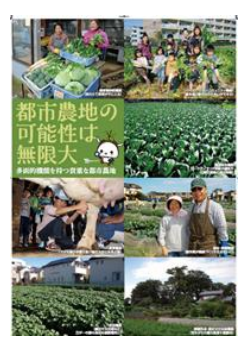
▲展示されているパネル②