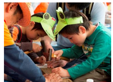
▲真剣に工作体験に取り組む子どもたち(昨年の様子)

けん玉や木工、水力船作りなど、奥が深い遊びや体験を行います。ステージでは、イクメン戦士ネリマックスショーや、子どもたちによる、ダンスや和太鼓演奏など、バラエティに富んだプログラムで会場を楽しませます。