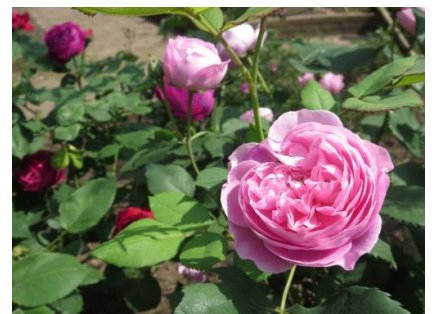
▲ 香りの良いバラを取り揃えました。