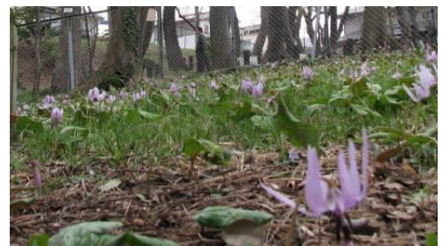
▲ 見ごろを迎えた清水山憩いの森 (平成27年3月30日撮影)

カタクリは、種子から花が咲くまでに7～8年かかり、草丈は10cmほど。2枚葉を出し、2枚の葉から出る茎の先に花をつける。花は通常薄紫色で下を向き、6枚の花びらを外に反り返らせて咲くのが特徴。一株の開花期間は一週間程度で、例年3月下旬から4月上旬にかけて次々に咲き始める。