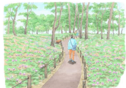
▲ (仮称)清水山公園 (イメージ)

23区唯一のカタクリの群生地であり、昭和51年に「清水山憩いの森」として一般に公開。「東京の名湧水57選」にも選ばれている。区ではこの貴重な自然を末永く保存するために「(仮称)清水山公園」として新たに整備する。整備にあたっては、区民からの寄付を原資とした練馬区みどりを育む基金を活用する。平成29年3月に開園予定。