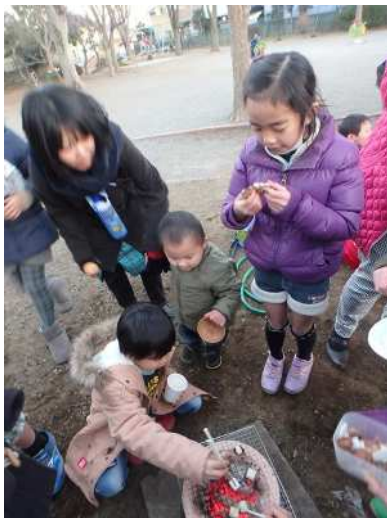
七輪でお餅を焼いたよ