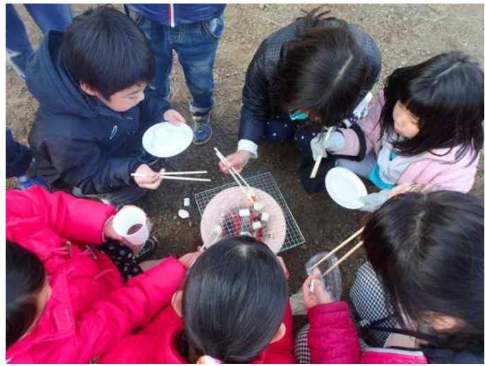
七輪を囲んでほっこり