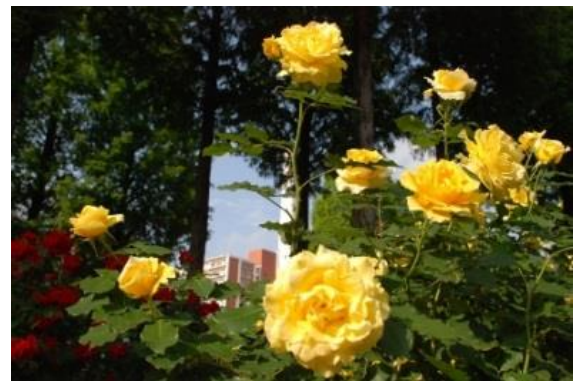
▲ローズガーデンでバラの香りをお楽しみください