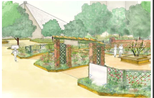
▲～バラの香りを楽しむ庭～四季の香ローズガーデン(イメージ)

同ガーデンは香りごとにバラを植栽し、フルーティーな香りや、スパイシーな香りなど6種類のバラの香りや、既存のバラ園と合わせて約220品種の鮮やかなバラを楽しむことができます。オープン後は、バラの香りを楽しむガーデンツアーや香水づくりなど、イベントを通じてバラの香りの魅力を伝えていきます。