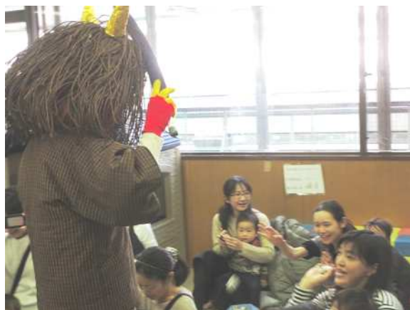
鬼退治をする親子