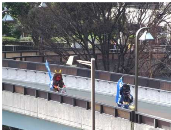
自転車で移動する鬼