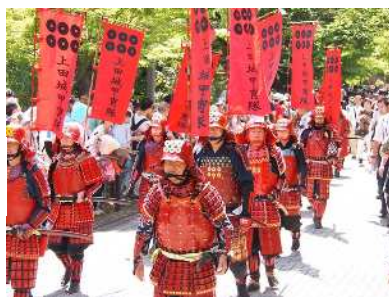
【昨年の照姫まつりより、甲冑隊(左) 真田陣太鼓(右)】

去年は、練馬区の「照姫まつり」に、赤い鎧を身にまとった甲冑隊の照姫行列参加や、信州上田真田陣太鼓保存会の太鼓演奏などでまつりを盛り上げるなど、友好交流を続けています。