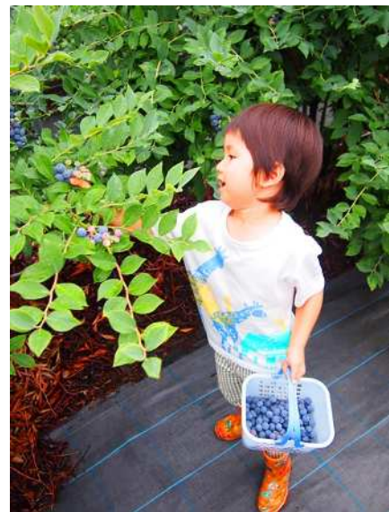
【3歳のブルーベリー摘み名人】