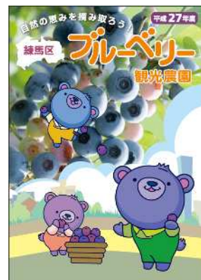
平成27年度 練馬区ブルーベリー観光農園 パンフレット

【問い合わせ】産業経済部 都市農業課 農業振興係 電話 03-5984-1403