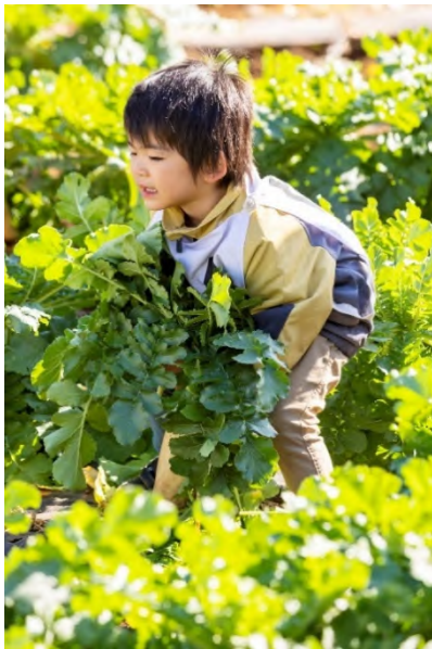
練馬大根引っこ抜き大会