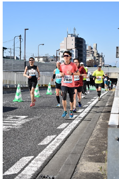
練馬こぶしハーフマラソン