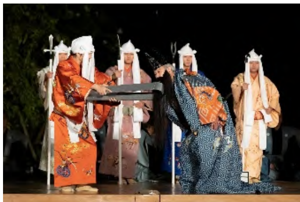
みどりの風 練馬薪能