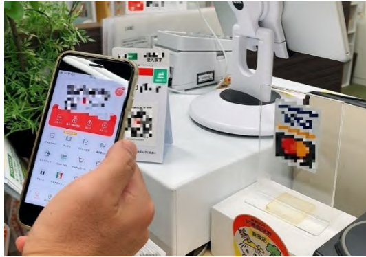
キャッシュレス決済を利用した支払