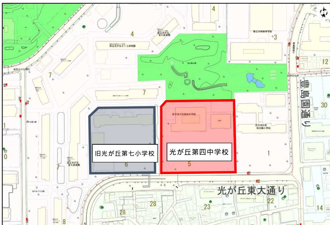
図表 - 2 学校跡施設配置