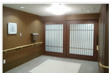
和風基調のユニット玄関