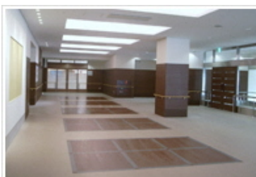
明るく広いエントランス