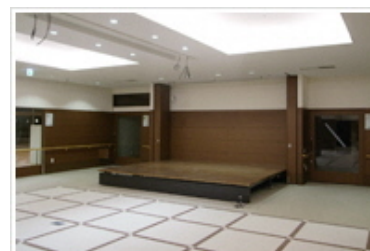
大勢の方が集える地域交流ホール