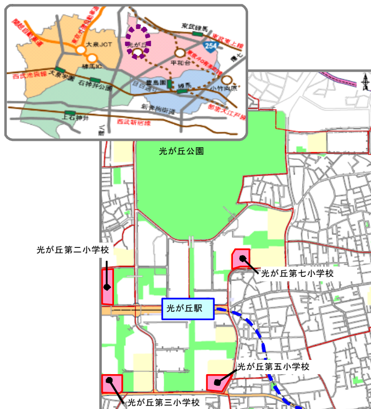
図表- 5 光が丘地域の概要