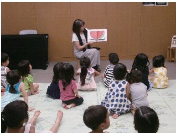
よみきかせをしているボランティア