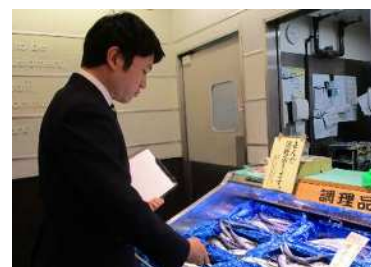
店頭での監視の様子