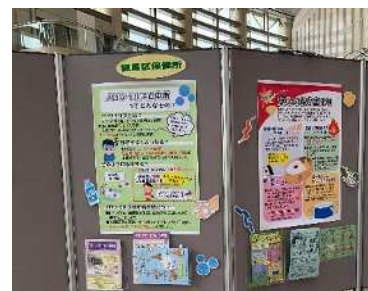
消費生活パネル展への参加

区民の食品衛生意識の向上のため、要望に応じて食品衛生出前講習会を実施し、食品衛生に係る情報を提供します。また、庁内他部署の実施するイベントに出展し、来場する消費者に対して積極的に食品衛生知識の普及啓発を行い、食品による健康被害発生の防止に努めます。