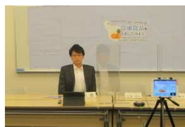
オンラインで開催した 「練馬区食の安全・安心講演会」

食の安全・安心について区民の関心が高いテーマを選定し、講演会等を開催します。ただし、新型コロナウイルス感染症の感染状況を鑑み、オンライン形式での開催も視野に入れます。区民、食品等事業者、行政関係者が質疑応答等を通じ意見交換を行い、それぞれの立場に対する理解を深めることにより、食の安心確保を図ります。