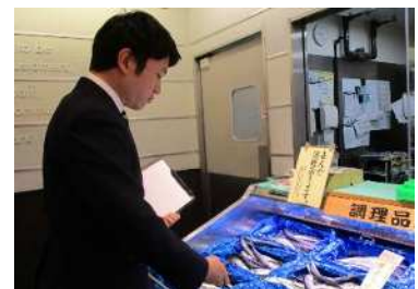
店頭での監視の様子