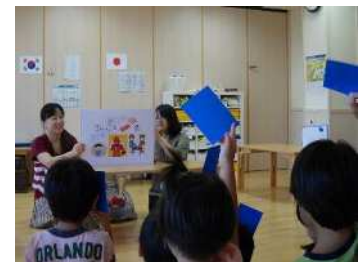
手洗い教室の様子

食育基本法（平成17年法律第63号）を踏まえ庁内関係部署と連携し、児童を対象に、食品衛生知識の普及啓発を図ります。また、食中毒予防のための正しい手洗いを児童に周知するため、保育園児や小学1年生等を対象に「食の安全教室（手洗い教室）」を実施します。また、食育推進事業を通じて、食品衛生知識の普及啓発を図ります。