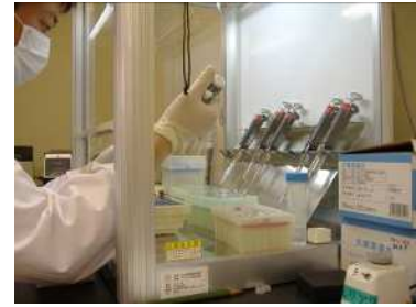
生活衛生課試験検査係での検査の様子

なお、民間登録検査機関に対しては、委託契約に基づき業務の適正な管理を求め、必要に応じて精度管理の実施記録を確認します。