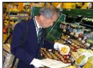
店頭での監視の様子