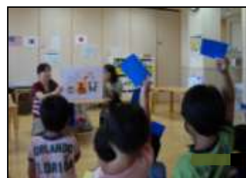
手洗い教室の様子

近年多発しているノロウイルスによる食中毒をはじめ、食中毒予防には手洗いが有効です。正しい手洗いを子供のうちから身につけてもらうため、保育園児・小学1年生を主な対象とした「食の安全教室(手洗い教室)」を実施します。また、食育推進事業を通じて、食品衛生知識の普及啓発を図ります。