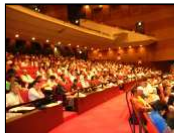
食品衛生実務講習会の様子

すし店、食肉販売店といった業態ごとの営業者・食品衛生責任者 ※8 を対象に、それぞれの業態の特性を踏まえた衛生管理についての講習会を実施します。