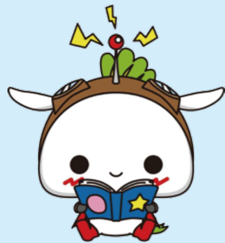
練馬区公式アニメキャラクター「ねり丸」 © 練馬区

「アニメのまち 練馬区」をPRするため、平成23年3月に決定した公式アニメキャラクターです。 「練馬大根」と、区名の「馬」をイメージしています。