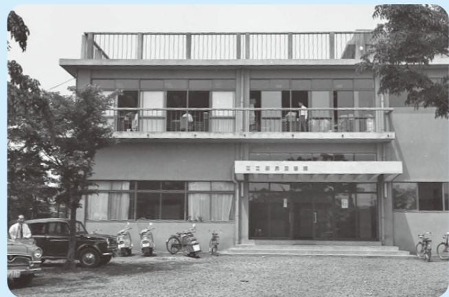
開館当初の練馬図書館