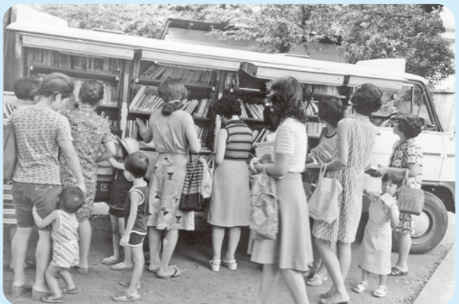
昭和50年頃の移動図書館の様子