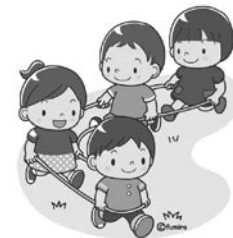
（仮称）こども発達支援センターの整備