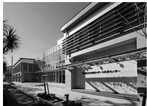
中村南スポーツ交流センター（平成21年1月開館）