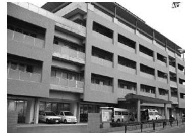
大泉特別養護老人ホーム