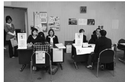
研修センターによる就職面接会