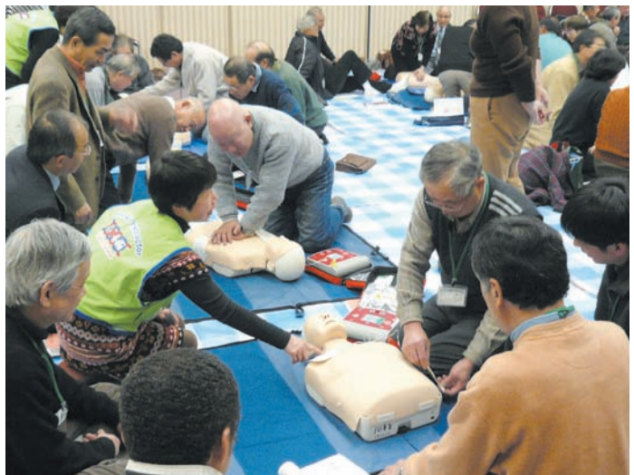
防災リーダー育成講習会

防災、健康、福祉、子育て支援、環境など、地域の重要な課題の解決に取り組む人づくりを、区民や団体との協働により進めます。また、就労している人、子育て中の人、退職後の人など、さまざまな区民が自らの関心に基づいて積極的に学び、その成果を活かして地域で活躍できるよう、総合的な情報提供や活動支援の仕組みを整えていきます。