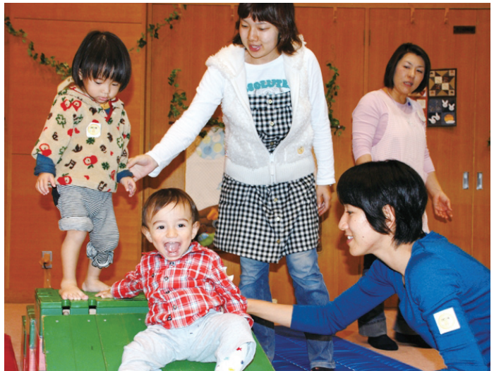
光が丘地区子育ての輪