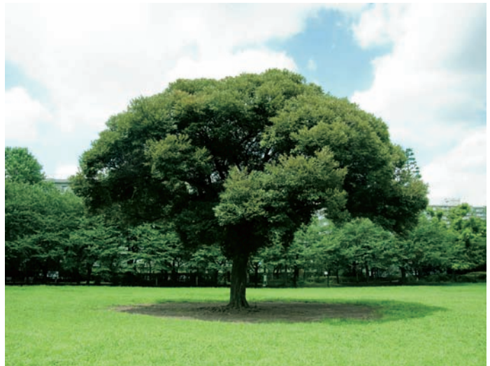
夏の雲公園（光が丘）

基本構想の目標年次は、区民が実現可能性・実効性を実感できる構想とするため、練馬の未来を見通しつつ、概ね10年後の平成30年代初頭とします。