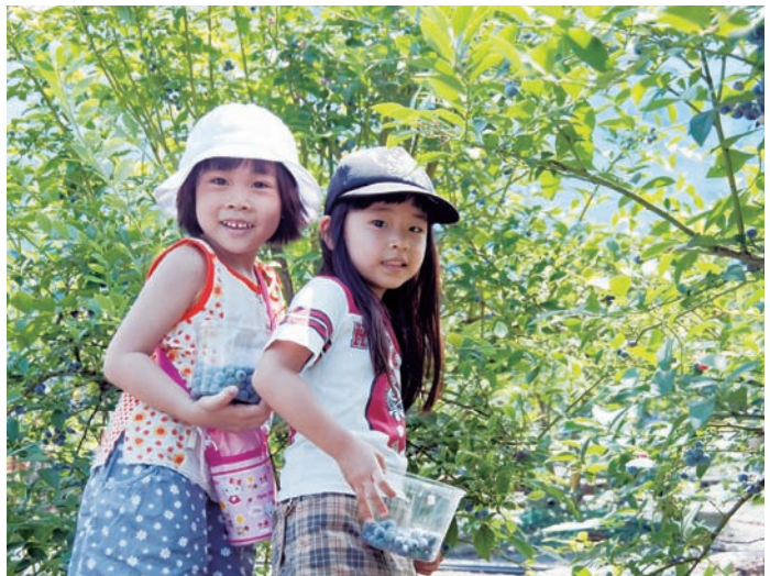
ブルーベリー観光農園

都市の農業・農地がもつ多面的機能が一層発揮され、農業・農地と都市が共存する「農のあるまちづくり」を進めます。