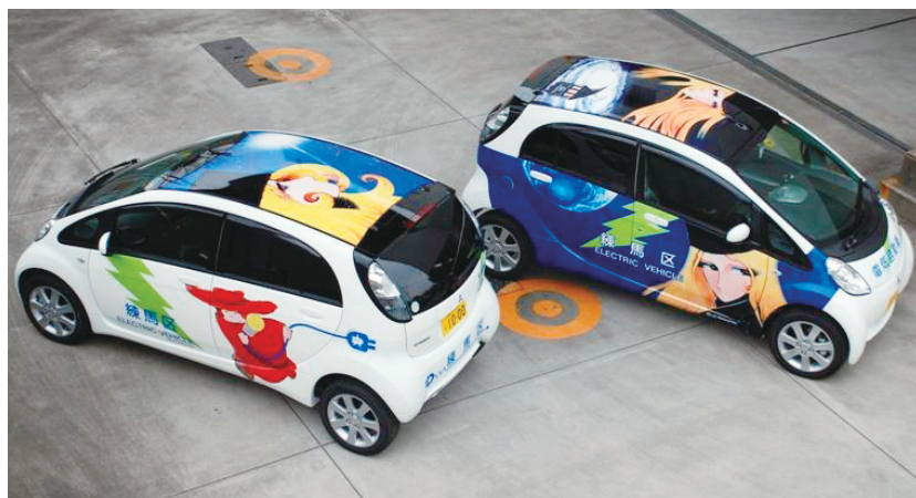
松本零士さん原作のアニメのキャラクターをラッピングした区の電気自動車