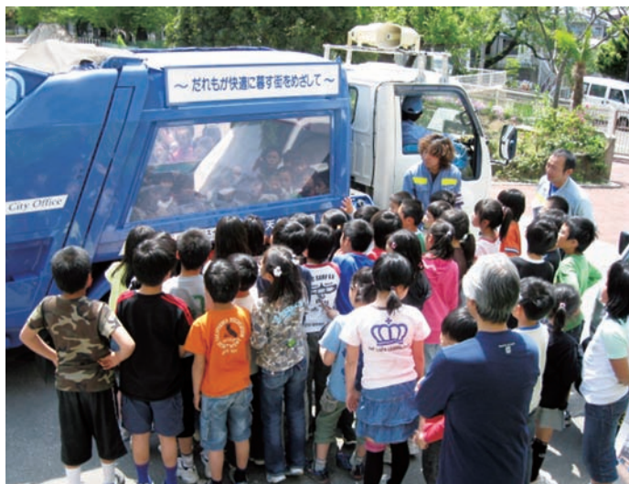
小学校の環境学習

再生可能エネルギー ■ 将来枯渇の恐れがある石油、石炭等の化石燃料や、原子力に対し、太陽光発電、太陽熱利用、バイオマス燃料など、自然環境の中で繰り返し起こる現象から得られる、再生使用することが可能なエネルギーを指します。