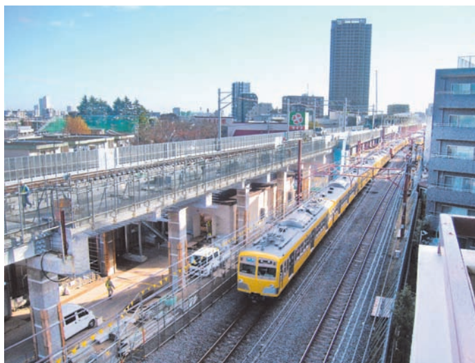
高架化工事が進む西武池袋線（石神井公園駅付近）

総合治水対策 ■ 雨水の処理を「河川対策」だけに頼らず、一時的に雨水を貯めたり、地下に浸み込ませたりすることで、流域全体で雨水の流出を抑える「流域対策」も含めた対策です。