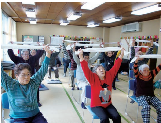
敬老館での体操教室

病床の確保 ■ 練馬区内の病床数は人口に比較して極端に少ないということから、平成3年4月に日本大学医学部付属練馬光が丘病院を、平成17年7月に順天堂大学医学部付属練馬病院を誘致してきました。しかし、平成20年6月現在も、練馬区の人口10万人当たりの一般病床および療養病床は、23区平均の3分の1程度に過ぎず、23区の中で最も少ない状況にあります。このため、病床の確保は区の重要な課題になっていますが、これまでは、東京都保健医療計画において、練馬区が属する区西北部二次保健医療圏（練馬区、豊島区、板橋区、北区）は、既存病床数が基準病床数を上回っていたため、病床を増やすことが困難でした。しかし、同計画が平成20年3月に改定され、区西北部二次保健医療圏の一般病床および療養病床が不足することとなり、増床が可能となりました。これを受け、区では、病床を確保するための検討を行っています。