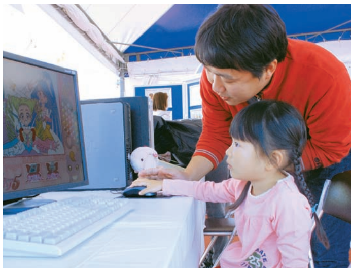
練馬アニメカーニバル 2009 のアニメ制作体験教室

アニメ文化を区の内外に発信することで練馬の魅力をさらに高めていきます。アニメを区のさまざまな施策展開に活用し、アニメを核として区民の地域への誇りを醸成します。