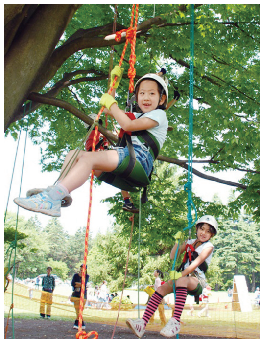
練馬こどもまつりでのツリークライミング