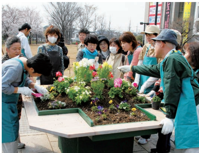
区民の皆さんによるバリアフリーの花壇づくり

そして、みどりを活用する多彩な取組を通じて、環境資産*である土や水、空気、生きものなどを含めた、自然と生命を大切に する環境都市練馬区*を実現していきます。