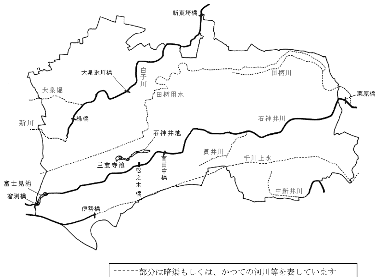
図1 区内の河川・池と水質調査場所

石神井川、白子川ともに、下水道が完備し、大雨後の下水道越流水以外の生活排水は流入しなくなりました。そのため、平成10年頃までにかけて水質の改善が続き、以降はほぼ横ばいで推移しています。