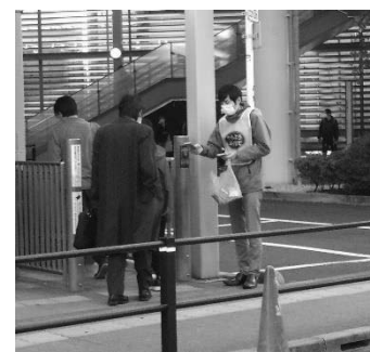
キャンペーンの様子

令和3年度は区内1駅周辺（12月 光が丘駅）において啓発用ティッシュペーパーや携帯用吸い殻入れの配布を行い、まちの美化の推進、喫煙マナーの向上を呼びかけました。