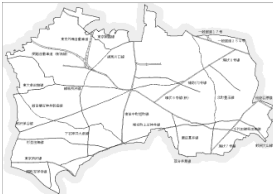
練馬区内における対象道路（総延長 80.8 km、平成 18 年 3 月 31 日現在）

国土交通省が実施している「全国道路交通情勢調査 一般交通量調査」（以下「道路交通センサス」という）は都道府県以上の道路および政令指定都市の主要市道を調査対象道路としており、「幹線道路を担う交通」は、概ね道路交通センサスの対象道路とみなしてよい（但し、交通不能区間及び未供用区間を除く）。また、道路交通センサス調査対象区間とはなっていない 4 車線以上の市町村道も「幹線交通を担う道路」である。