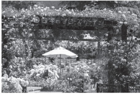
四季の香ローズガーデン