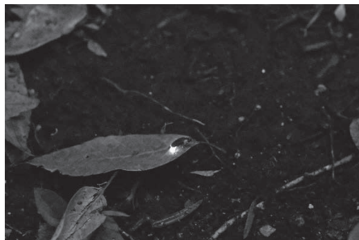
中里郷土の森緑地のホテル

平成29年3月にみどりや生き物と触れ合う体験ができる施設として開園した緑地です。周辺の町会や商店会の協力により、毎年、ホテルの観察会を開催しています。令和5年度は、13日間で1,887人の参加がありました。また、年間の来園者数は12,214人でした。